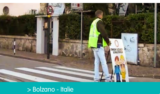
> Bolzano - Italie