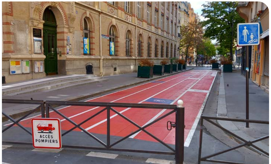
> Paris - rue Charles Baudelaire

Suite à la crise de la covid 19, les exigences en matière de mobilité et de sécurité ont évolué et les projets de rues scolaires ont souvent été retenus comme solution standard devant les écoles.